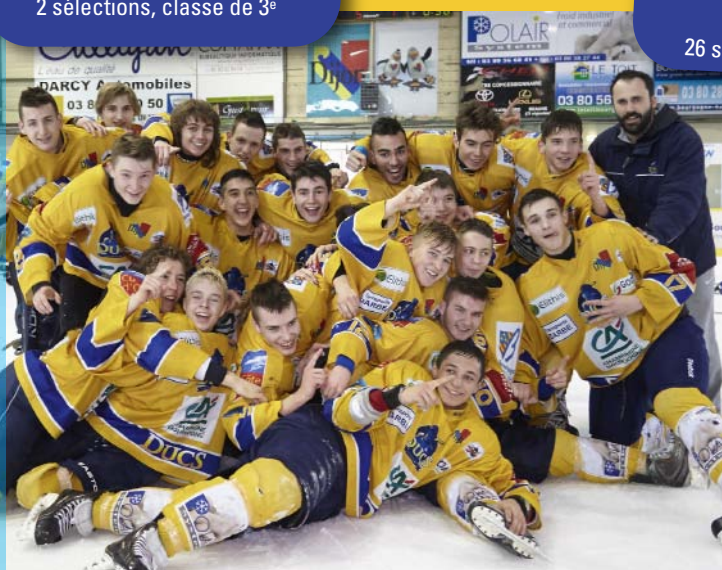
U18 Champions de France Elite B en 2010 et en 2013